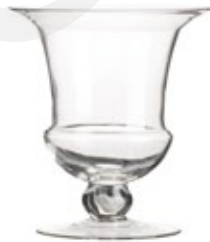
DG-CHRSF M. NEW

Porta Vela Cristal "Huracán Sofia" Glass Cadle Holder "Hurricane Sofia" Porte Bougie en Verre "Ouragan Sofia" Ø 24,4 x 35,5 cm.