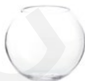
DG-CCR M. Porta Vela Cristal Circular Circular Glass Cadle Holder Porte Bougie en Verre Ronde Ø 13,4 x 11,5 cm.