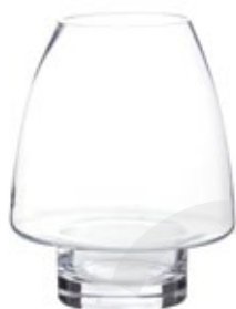
DG-CTP M. Porta Vela Cristal "Tulipa" Glass Cadle Holder "Tulipa" Porte Bougie en Verre "Tulipa" Ø 19 x 24,5 cm.