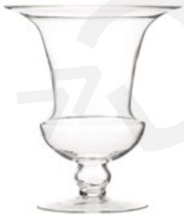
DG-CHRSF L. NEW

Porta Vela Cristal "Huracán Sofia" Glass Cadle Holder "Hurricane Sofia" Porte Bougie en Verre "Ouragan Sofia" Ø 24,4 x 35,5 cm.