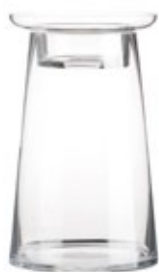
DG-CFR M. NEW Porta Vela Cristal "Faro" Glass Cadle Holder "Lighthouse" Porte Bougie en Verre "Phare" Ø 16 x 32,5 cm.