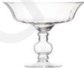
DG-CBWS M. NEW

Porta Vela Cristal "Huracán" Glass Cadle Holder "Hurricane" Porte Bougie en Verre "Ouragan" Ø 12,5 x 20,7 cm.