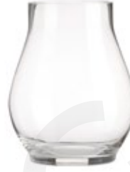
DG-CHRAD M. NEW

Porta Vela Cristal "Huracán Sofia" Glass Cadle Holder "Hurricane Sofia" Porte Bougie en Verre "Ouragan Sofia" Ø 20,3 x 26,7 cm.