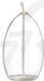
DG-CLA L. NEW Cristal Lámpara Aceite Oil Glass Lamp Lampe en Verre Huile Ø 8 x 14,5 cm.