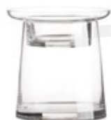
DG-CFR S. NEW Porta Vela Cristal "Faro" Glass Cadle Holder "Lighthouse" Porte Bougie en Verre "Phare" Ø 15,8 x 20,5 cm.