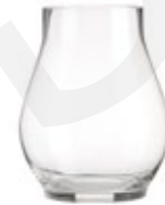
DG-CHRAD S. NEW

Porta Vela Cristal "Huracán Andorra" Glass Cadle Holder "Andorra Hurricane" Porte Bougie en Verre "Ouragan Andorre" Ø 20,6 x 30,3 cm.