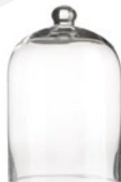
DG-CCAM M. NEW Porta Vela Cristal "Campana" Glass Cadle Holder "Bell" Porte Bougie en Verre "Cloche" Ø 12,7 x 19 cm.